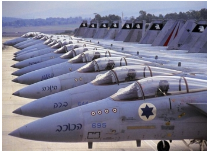
طائرات حربية إسرائيلية

على رؤوسه، أمّا التنين، فيستمد قدرته من ذاته، لذلك يوجد على رؤوسه تيجان. إنه ملك الشر المتوّج.